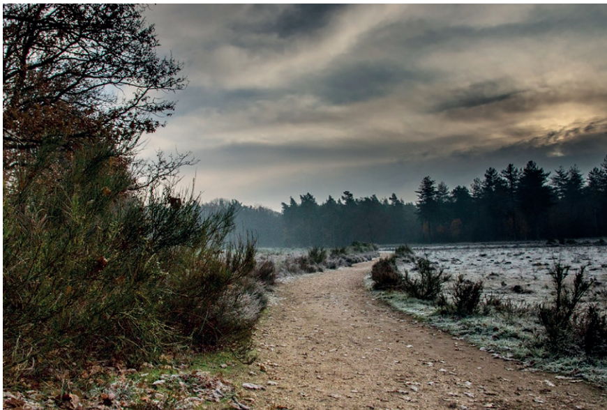
1e prijs: Wijnand Smart